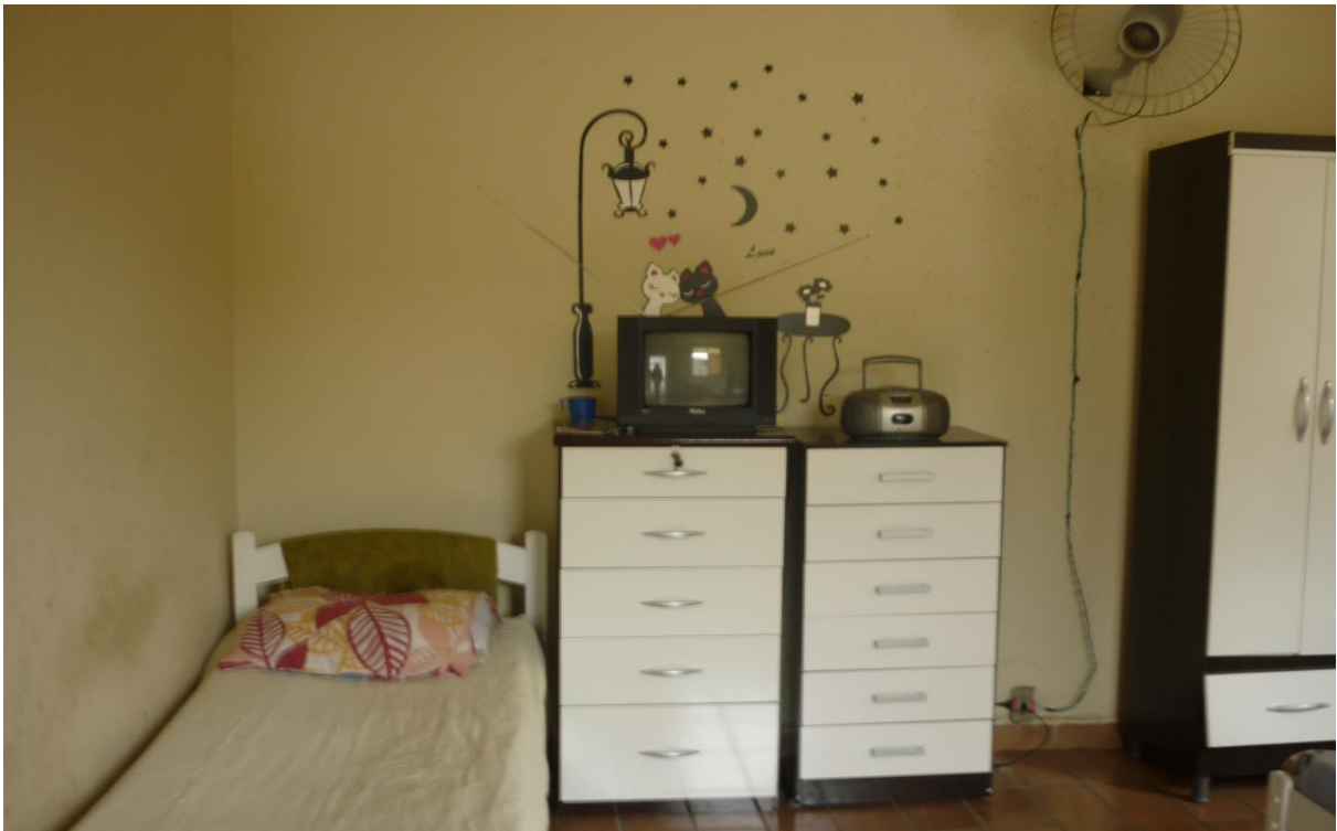
Figura 03: Vista interna da casa/abrigo no HH.

A fala a seguir esclarece alguns impasses que marcaram esse processo de ‘transição’: