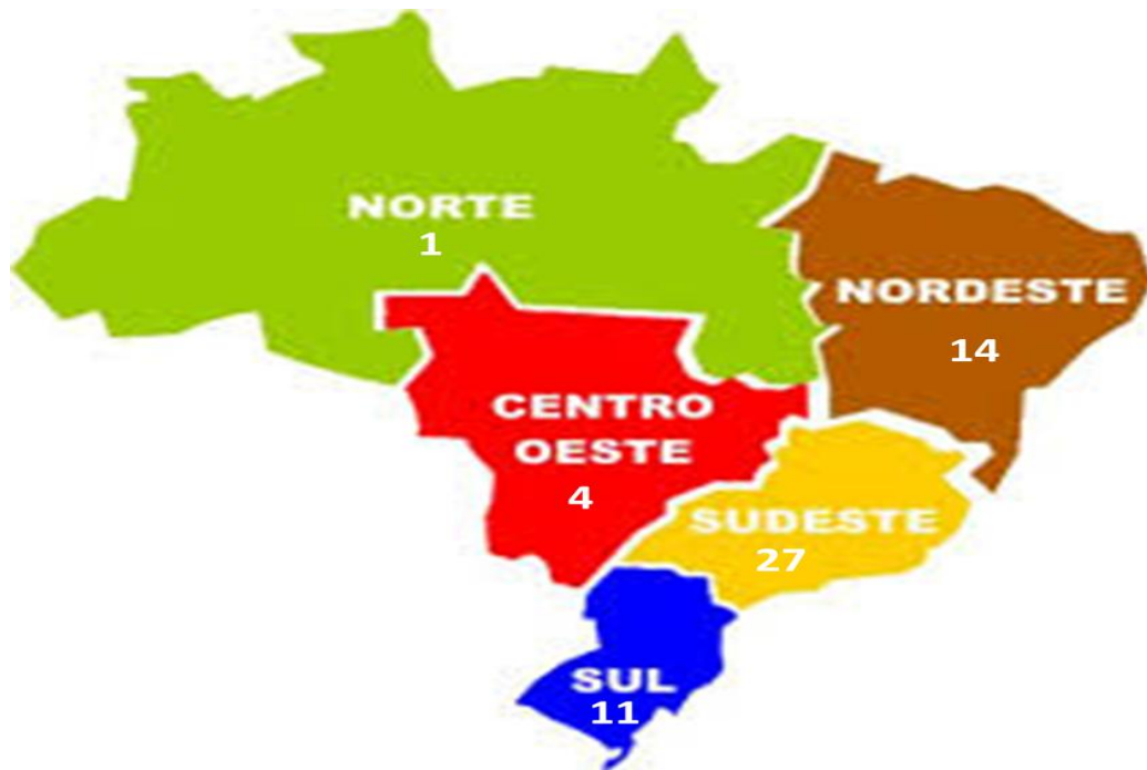
Figura 1- Distribuição Geográfica dos Programas de Pós-Graduação em Economia no Brasil - 2015