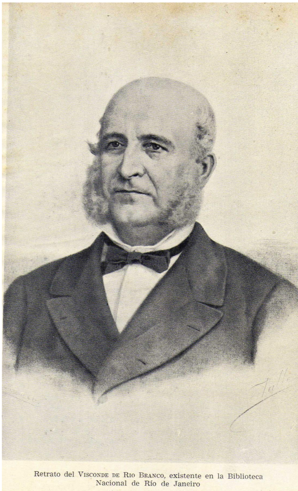
Retrato del VISCONDE DE RIO BRANCO, existente en la Biblioteca Nacional de Río de Janeiro