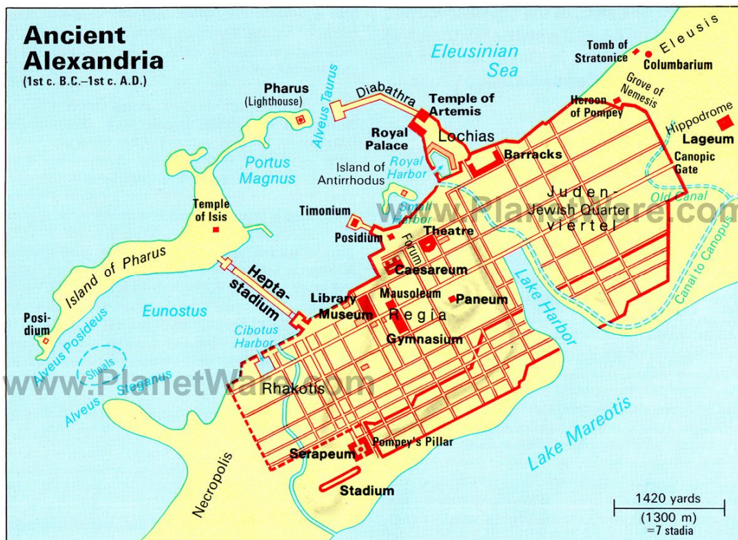
Mapa 2: Alexandria na Antiguidade

Não existem vestígios da antiga Biblioteca. No entanto, os arqueólogos conjecturam que não seria muito longe do porto (na região do Bruquión), pois quando César ateou fogo em 48 a.C. parte dos prédios foi destruída. É provável que se situasse onde hoje é a Universidade, próxima ao local da nova Biblioteca de Alexandria. Segundo Estrabão (historiador e geógrafo grego que descreveu com detalhes a Alexandria de sua época em aproximadamente 29 a.C.), se fizesse parte do conjunto real, teria grandes salões de mármore (construídos de acordo com o aumento de livros), cheios de estátuas, ricos tapetes e alfombras, rodeados por pátios e jardins com fontes e plantas aromáticas. Da Biblioteca Filha no Serapeum – Flower (2002, p. 116, 54-55, 57) descreve a biblioteca como uma “vasta estrutura retangular de cento e setenta por cento e setenta e sete metros, à qual foi acrescentada uma série de edifícios que abrigavam a Biblioteca Filha” - restou apenas o que, provavelmente, foi uma sala de leitura com algumas estantes.