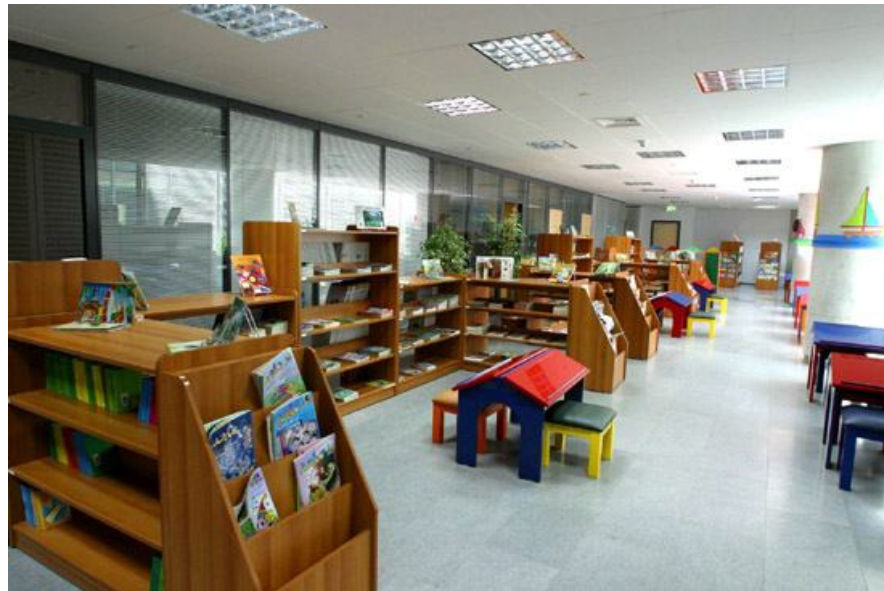
Fotografia 5: Biblioteca Infantil

Esta coleção inclui: livros de imagens, livros de leitura fácil, material de referência e material multimídia. Um laboratório de informática, monitorado pela equipe da biblioteca, oferece um ambiente seguro para as crianças explorarem vários sites na internet e aprenderem como fazer pesquisa em uma biblioteca. Localiza-se no primeiro andar, próxima à biblioteca para jovens;