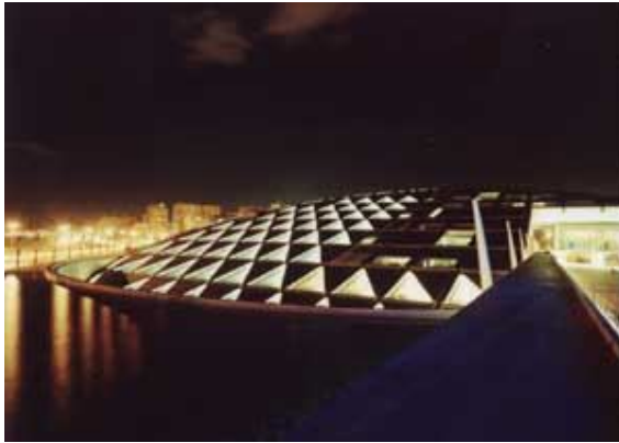
Fotografia 2: Vista externa

A arquitetura do prédio pretende indicar pelo uso da luz solar uma estampa visual, num processo estrutural desenvolvido em três camadas sobrepostas, em que a sombra solar e o exterior apresentam o conceito positivo-negativo como representação da complexidade da informação contida na biblioteca, assim como o teto visto como um microchip ditando as várias possibilidades de atividade interior e exterior.