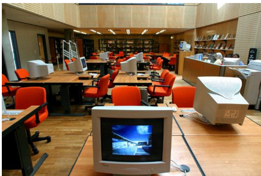
Fotografia 4: Biblioteca para Jovens

A Biblioteca dos Jovens oferece acesso a livros digitalizados, periódicos, multimídia e recursos eletrônicos, com acesso livre ao banco de dados do Centro de Recursos ao Estudante, abrangendo a maioria das áreas de pesquisa. Localiza-se no primeiro andar;