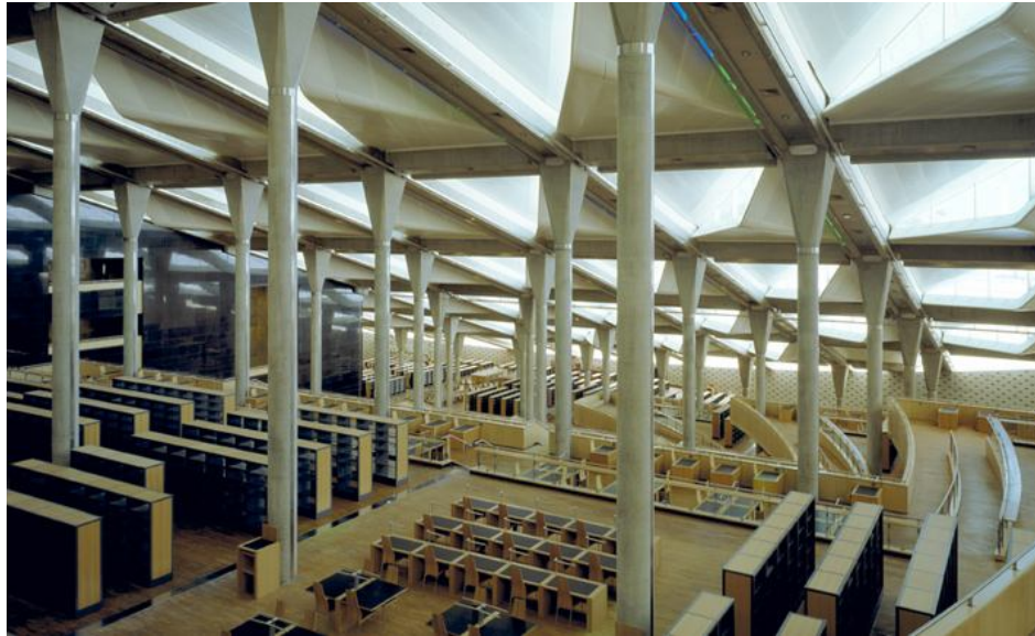
Fotografia 3: Vista interna

A proximidade da biblioteca com o centro de conferência permite o compartilhamento de facilidades culturais, ajudando a ligação de duas grandes idéias: debate e pesquisa, apesar de serem instituições independentes (ARCHITETURAL..., [2002?]).