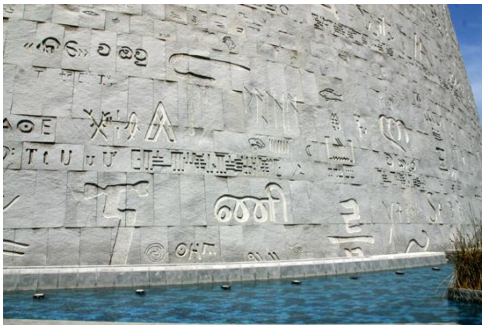
Fotografia 1: Muro com hieróglifos egípcios

O complexo possui um total de onze andares, sendo quatro deles abaixo do nível do mar formando um cilindro. O teto é feito de vidro e alumínio, lembrando o formato de um microchip quando visto de cima. O prédio tem uma inclinação de dezesseis graus, o que permite uma leveza ao complexo e facilita o controle da incidência de luz natural em seu interior por meio de um sistema retrátil de janelas. Este recurso faz com que o reflexo da luz solar no teto inclinado incida no Mediterrâneo, relembrando o antigo Farol de Alexandria – considerado uma das sete maravilhas do mundo. Ao redor do prédio principal foi erguido um muro de seis mil e trezentos metros quadrados com hieróglifos egípcios e letras de aproximadamente 120 alfabetos de todo o mundo (BARELLA, 2002; THE BIBLIOTHECA, [2002?]).