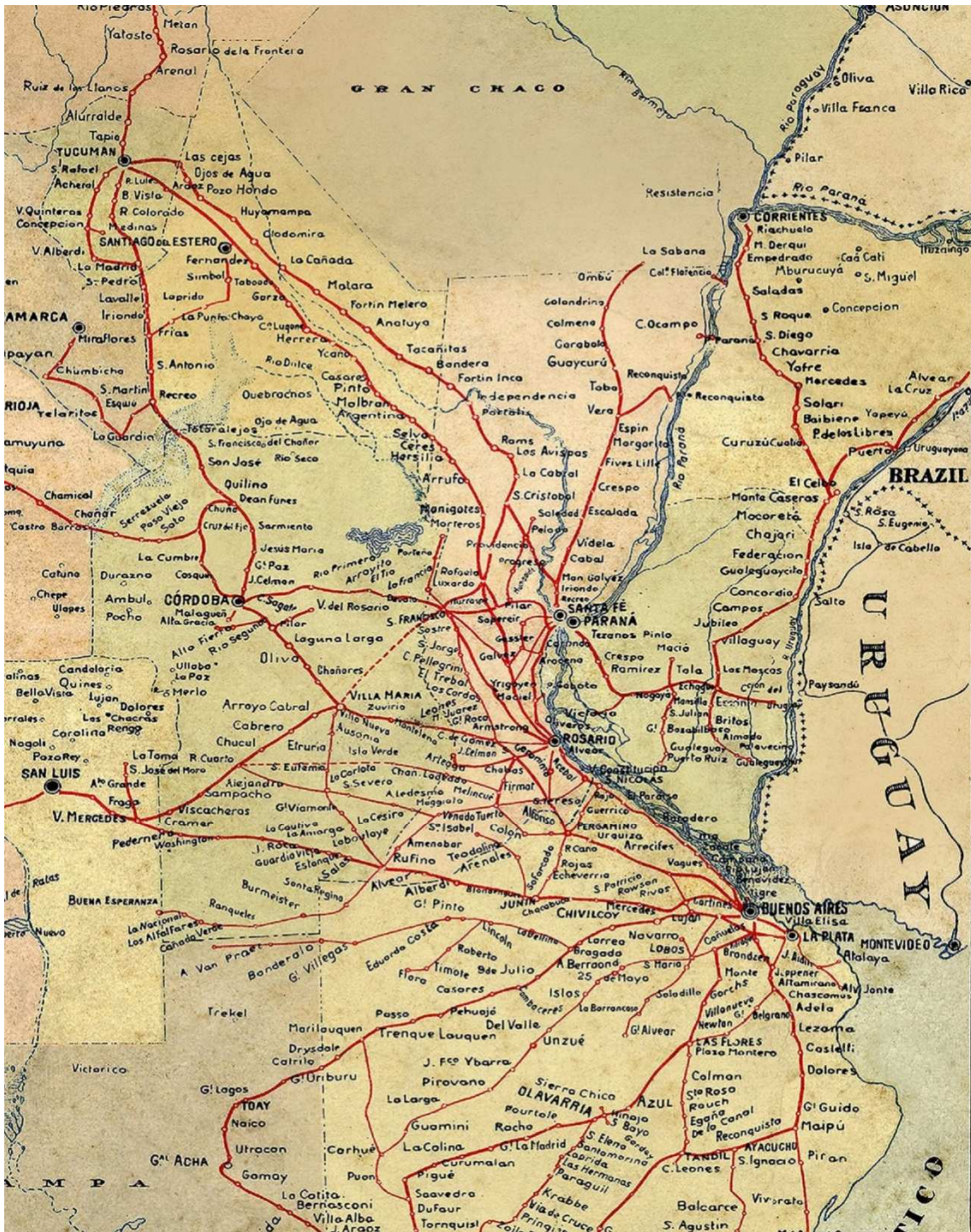
Figura 1. Mapa das redes ferroviárias da República Argentina, ano 1903.