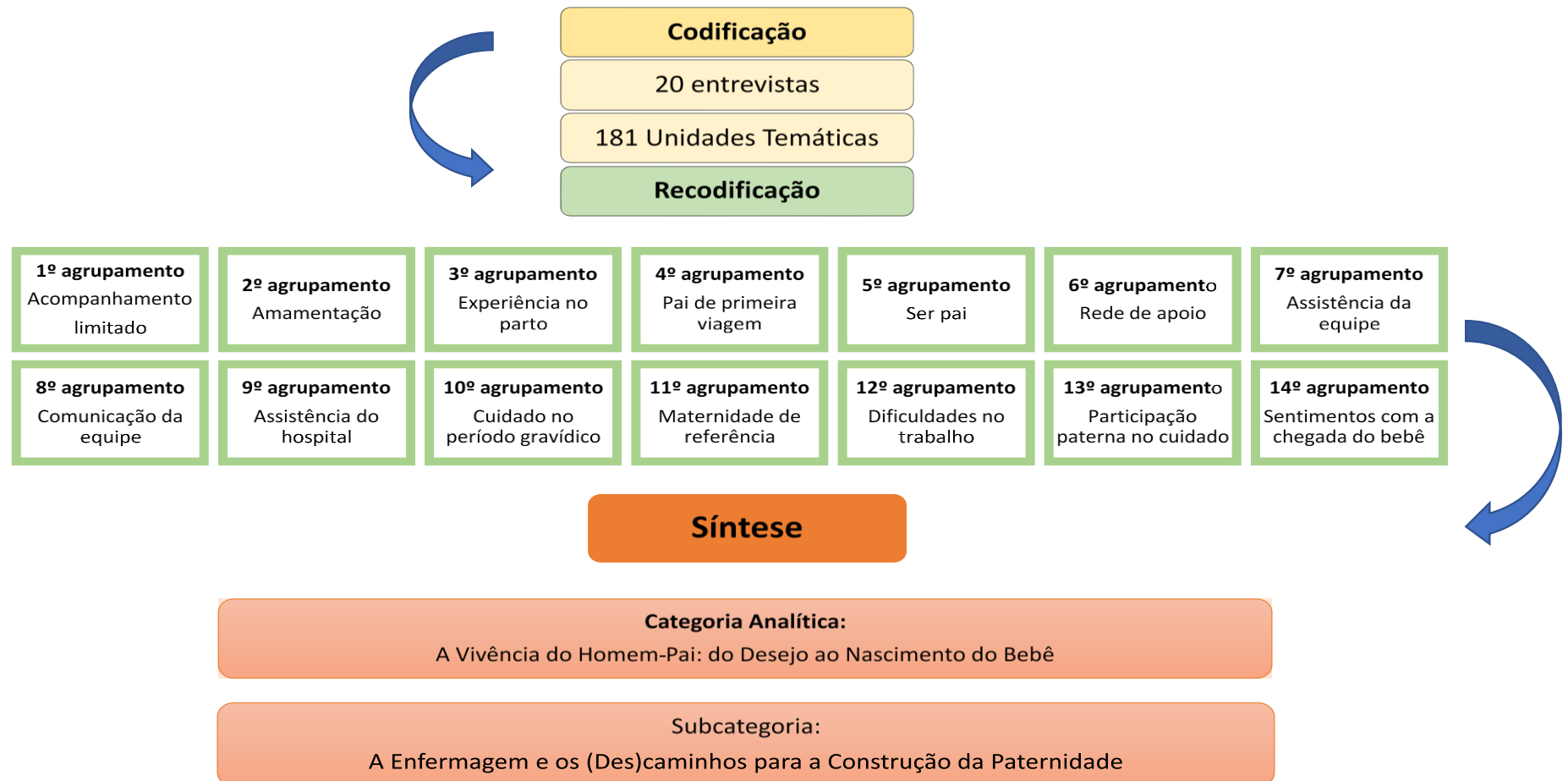
Figura 02 – Esquema de Análise das narrativas.