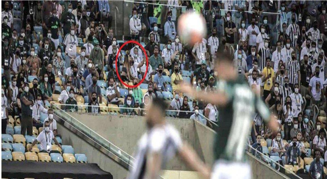
Imagem do momento do gol do Palmeiras na final da Copa libertadores 2020 15