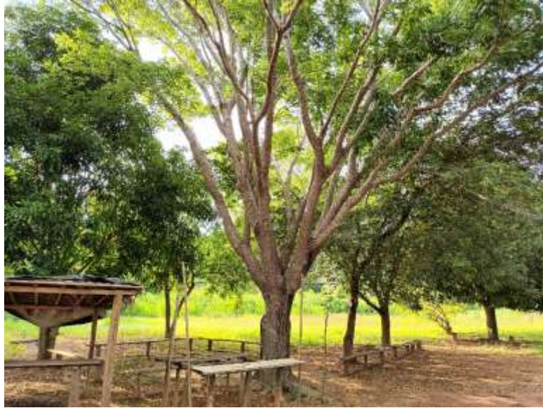
Figura 7 No primeiro plano, um cajá, cuja muda foi doada à Gerú Tucunã pelo IEF em 2010