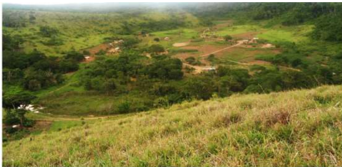
Figura 4 “Visão aérea da Gerú Tucunã em 2012”.

referência à natureza tão venerada pelos Pataxó. Na língua Patxôhã , “Gerú” significa “Papagaio”, que era o nome indígena de Paulo, o falecido pai de Bayara, e “Tucunã” é uma “palmeira” da qual nasce um coquinho chamado “tucum” ( Bactrissetosa ). Assim, na tradução literal, Gerú Tucunã significa “Papagaio na Palma do Tucum”. (SALVADOR, 2015, pp.7-8)