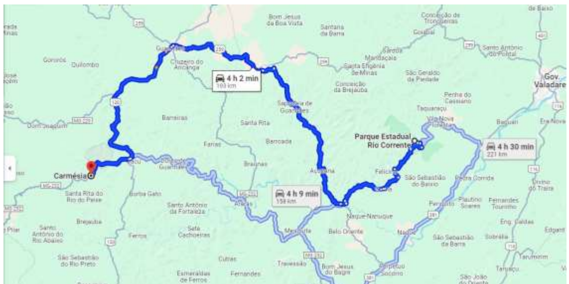
Figura 3 Distância entre o Parque Estadual do Rio Corrente e Carmésia, onde está a TI Fazenda Guarani, de onde os Pataxó de Gerú Tucunã saíram em 2010.