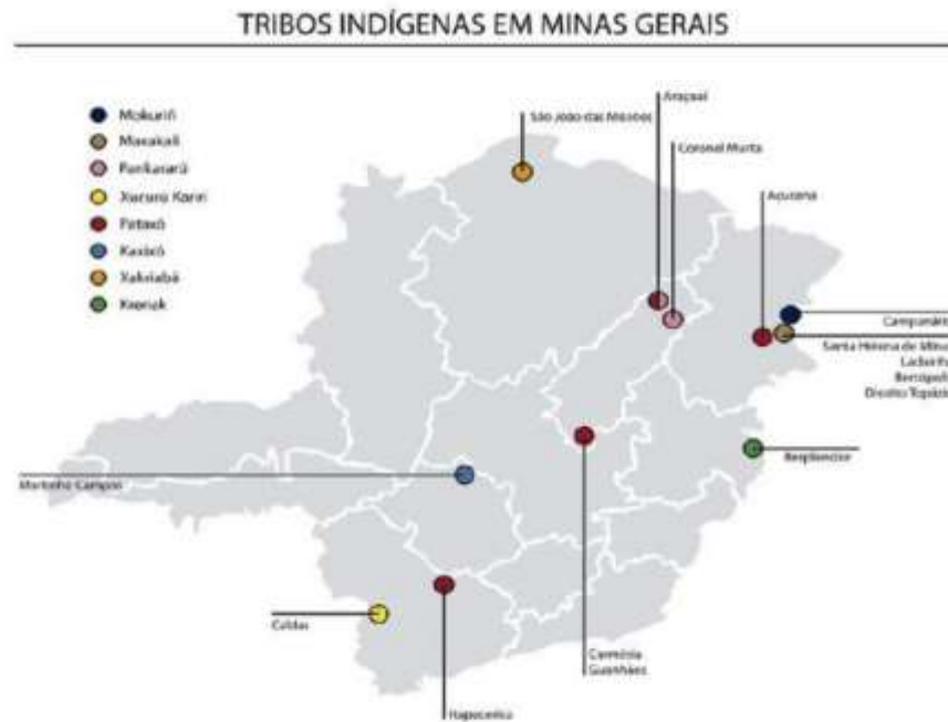
Figura 2 Localização dos Pataxó de Açucena e de Carmésia, em Minas Gerais. 10