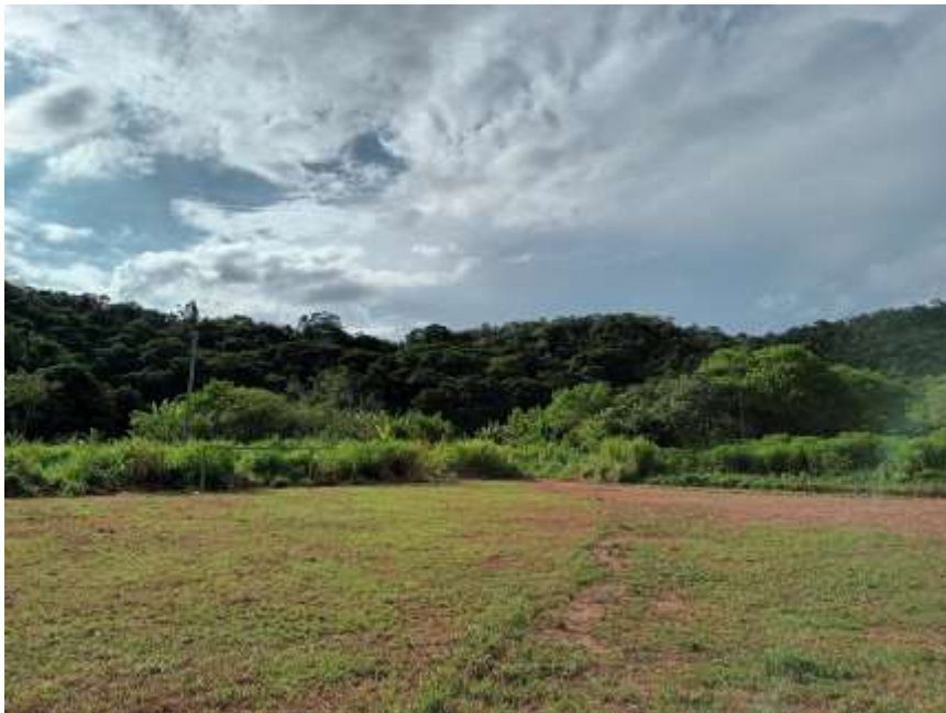
Figura 8 Ao fundo, área reflorestada pela Gerú Tucunã, onde havia predominância de braquiária antes de 2010