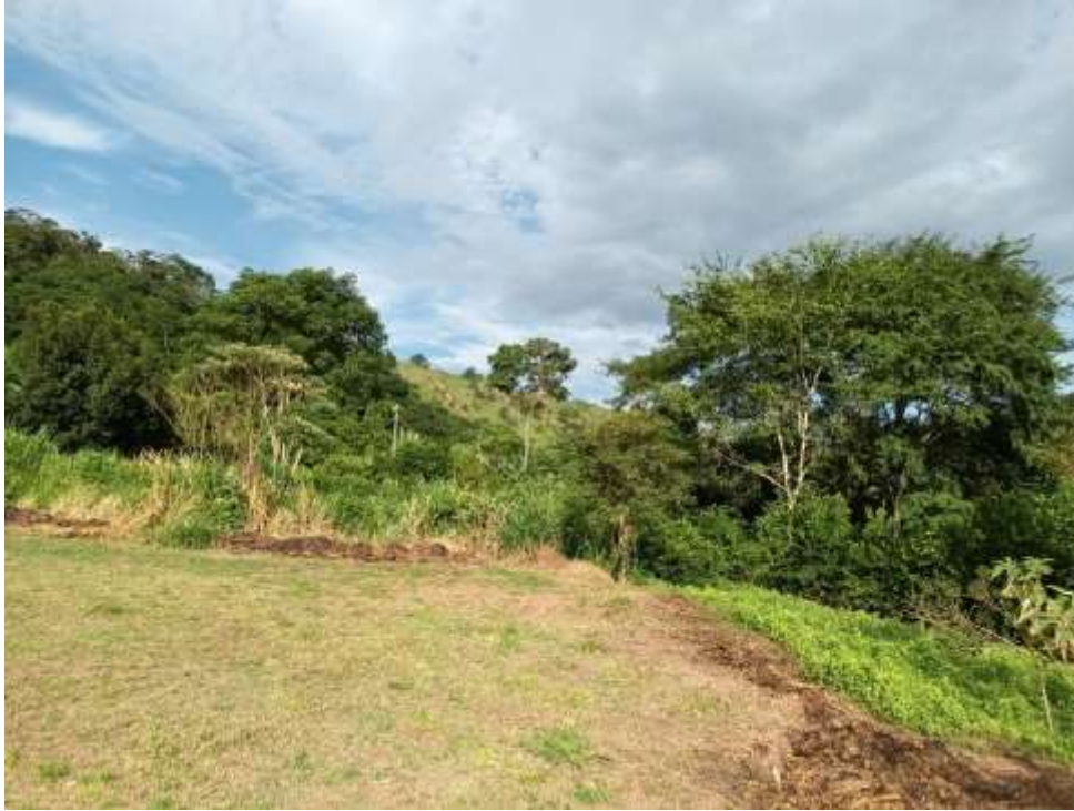
Figura 9 Ao fundo, área onde posseiros atearam fogo em 2010; atualmente, esta área está quase toda reflorestada por iniciativa dos Pataxó de Gerú Tucunã